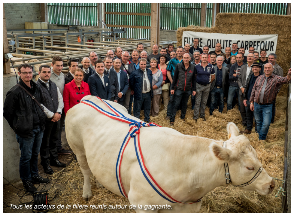
Tous les acteurs de la filière réunis autour de la gagnante.

Les animaux engagés dans la Filière Qualité Carrefour doivent répondre à un cahier des charges précis. Ce cahier des charges vise essentiellement les catégories d'animaux pour des vaches et des génisses, la production doit être française et être née, élevée et abattue en France et avec six mois minimum de pâturage et d'un âge inférieur à 12 ans. Après l'abattage, la viande doit avoir également un délai minimum de maturation 12 jours. Les critères de poids et d'âge sont en cours de réexamen, toujours dans le but de satisfaire au mieux la demande des clients qui se porte aujourd'hui principalement sur la tendreté et le goût.