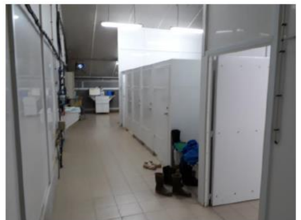
Bloc sanitaire 5 douches + sas 3zones