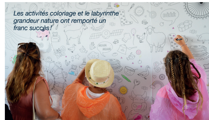
Les activités coloriage et le labyrinthe grandeur nature ont remporté un franc succès!