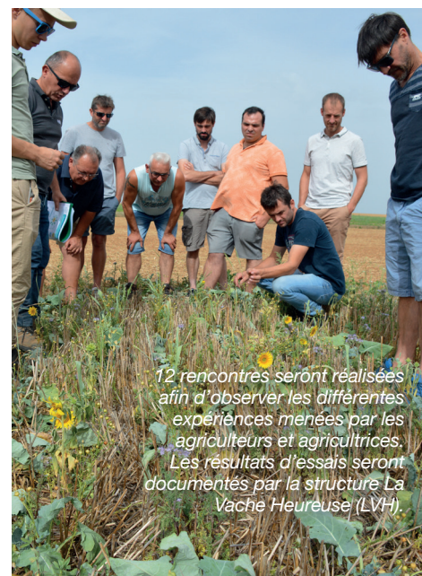
12 rencontres seront réalisées afin d'observer les différentes expériences menées par les agriculteurs et agricultrices. Les résultats d'essais seront documentés par la structure La Vache Heureuse (LVH).

Durant ces échanges sur le terrain, les participants observent « le management d'un couvert », par exemple en pratiquant le broyage, afin d'éviter de faire monter en graine les plantes et développer leur masse végétale, comme avec le radis lors des périodes de stress hydrique. Par ailleurs, en fonction des saisons, on peut privilégier certaines espèces. En prévision d'un automne doux, où la minéralisation est forte, on peut choisir des espèces nitrophiles pour capter l'azote fourni par le sol comme le radis, le seigle, l'avoine, ou la phacélie. À l'inverse, un sursemis de légumineuses peut être envisageable pour ré-enrichir le couvert et intégrer des plantes relais sur la période hivernale et constituer une fourniture d'azote disponible pour la culture de printemps : vesce, trèfle, féverole, etc. ■