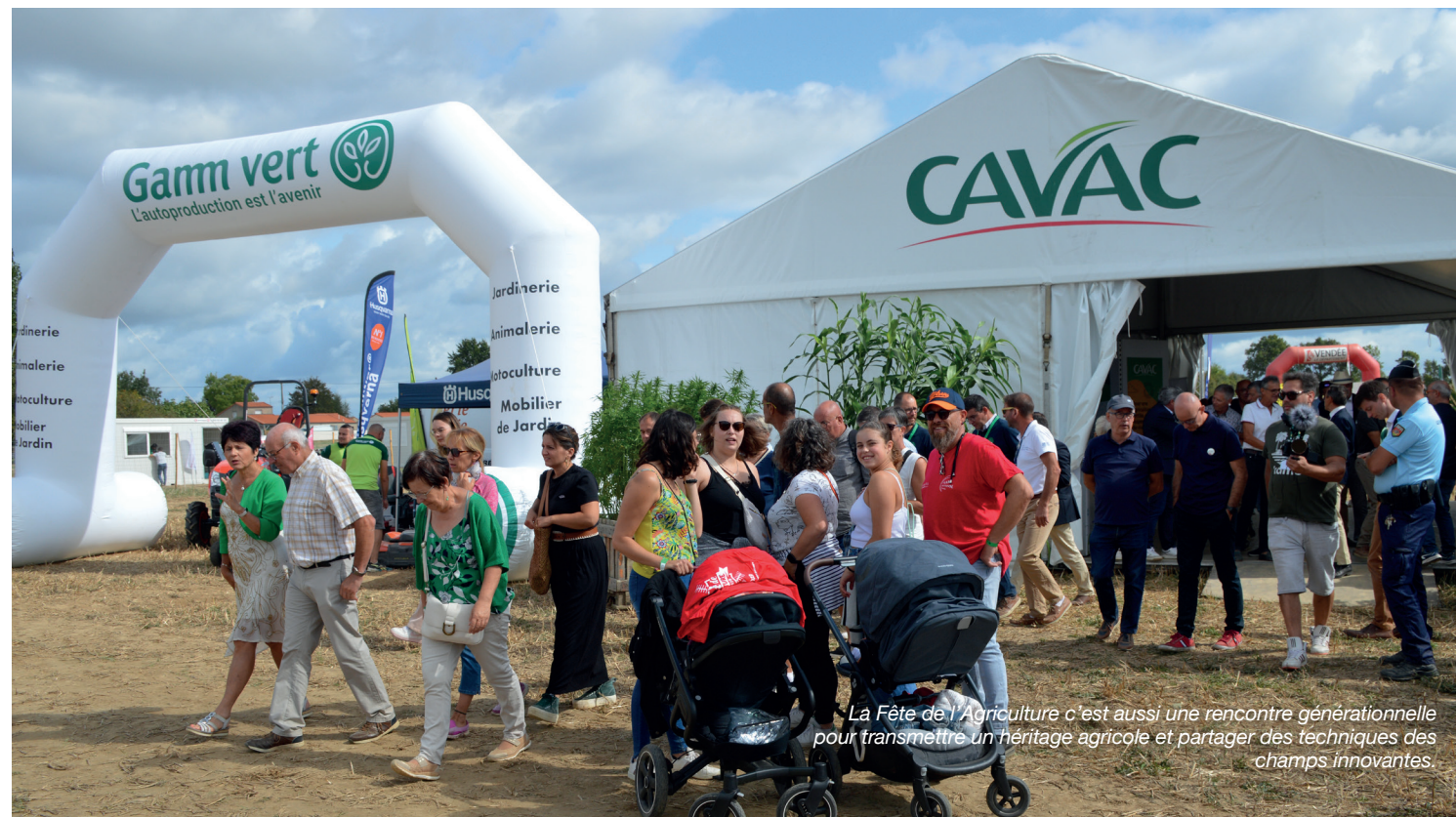
La Fête de l'Agriculture c'est aussi une rencontre générationnelle pour transmettre un héritage agricole et partager des techniques des champs innovantes.

Chaque année se déroule la fête de l'agriculture de Vendée. Un moment festif incontournable pour la coopérative qui tient son stand. L'occasion de partager avec les agriculteurs et les agricultrices de Cavac un moment convivial dans la joie et la bonne humeur.