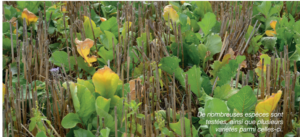
De nombreuses espèces sont testées, ainsi que plusieurs variétés parmi celles-ci.

Les premiers groupes de progrès pour une « agriculture régénérative des sols » ont été lancés. 40 agriculteurs et agricultrices de la coopérative sont venus visiter la plateforme d'essais des couverts végétaux. L'objectif ? Développer un réseau de parcelles expérimentales au sein des exploitations intéressées pour tester des itinéraires techniques innovants afin d'augmenter la résilience des sols.