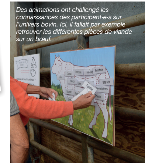
Des animations ont challengé les connaissances des participant-e-s sur l'univers bovin. Ici, il fallait par exemple retrouver les différentes pièces de viande sur un bœuf.

Plus de 600 éleveurs et éleveuses sont venus pour l'évènement au Margat, le centre d'allotement à La Ferrière. Toute l'équipe de Bovineo s'est mobilisée pour animer la journée autour de nombreuses activités ludiques. Tout un parcours «découverte» était proposé pour visiter la structure qui organise la commercialisation des animaux en filière. Le saviez-vous? 10 638 animaux ont été commercialisés cette année dans 12 démarches de qualité dont 60 % en Label Rouge (Blond, Fermier de Vendée, Parthenais) et 20 % en Bio.