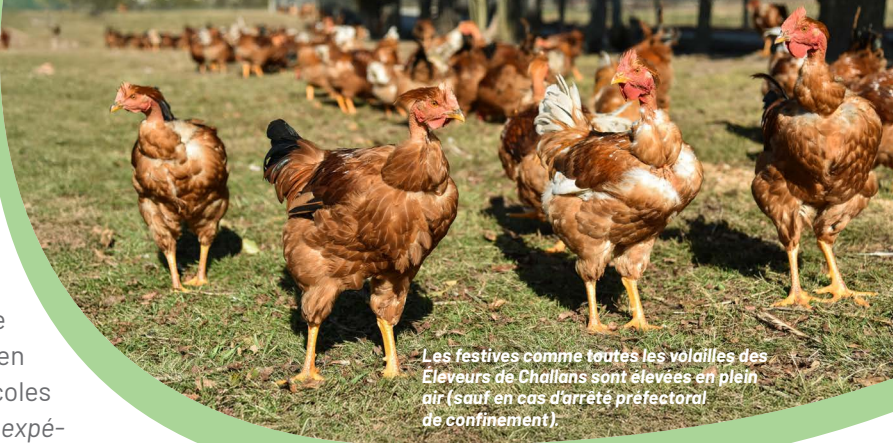
Les festives comme toutes les volailles des Éleveurs de Challans sont élevées en plein air (sauf en cas d'arrêt préfectoral de confinement).