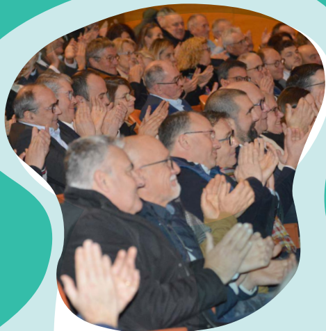
Assemblée générale Cavac, décembre 2024.

Éléments de réponse dans notre prochain numéro