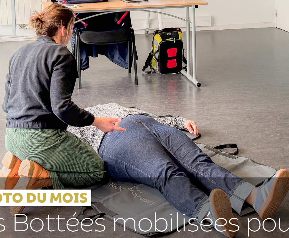
PHOTO DU MOIS